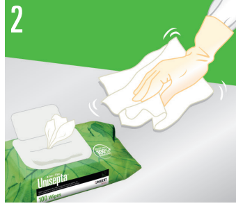
2 Mendili temizlenecek yüzeye uygulayın.