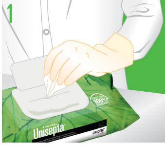
1 Mendili torbasından çıkarın.