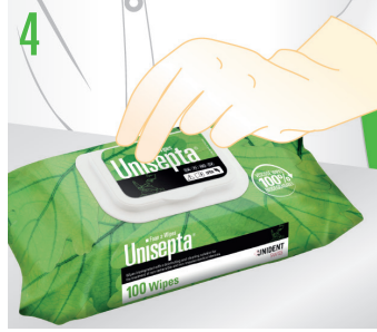
4 Her kullanımdan sonra torbanın ağzının iyice kapandığından emin olun.

İstenen mikrop öldürücü etki için, belirtilen temas süresine uyun. Tıbbi cihazın deri veya mukoza ile temas etme durumu hariç, herhangi bir durulama gerekmez.